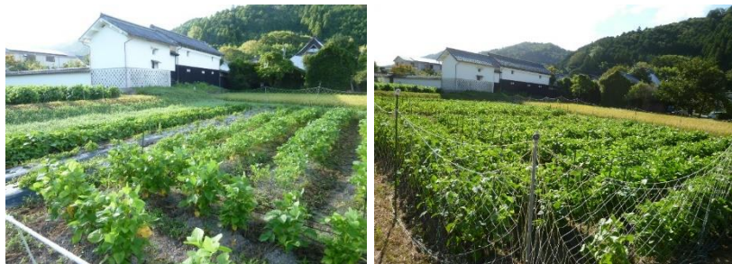
サツマイモ、山の芋、小豆、黒大豆、イネを栽培

8月は、熱中症防止で、夏休みとしましたが、畑と田んぼでは、猛烈な暑さと、雑草と、闘いながらグングンと生長しています。